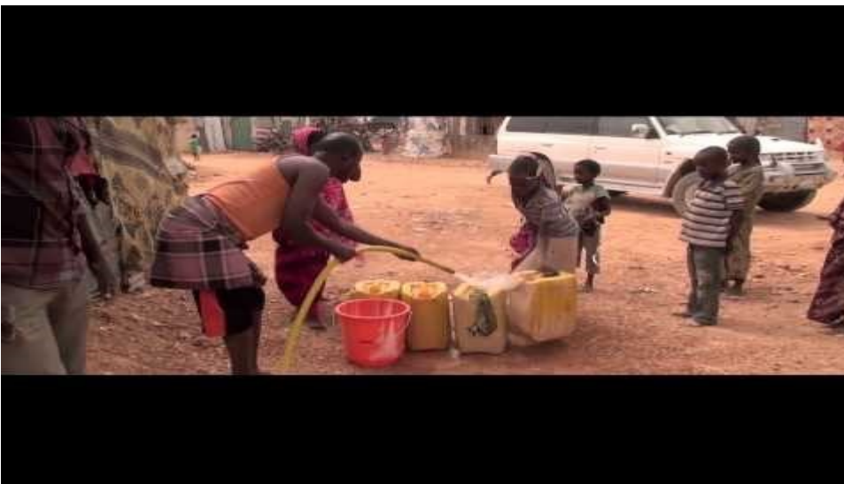
(12) Woda zmienia życie - YouTube