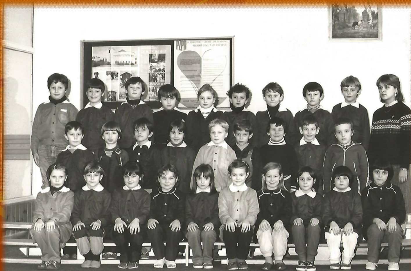
SZKOŁA PODSTAWOWA nr 18 KOSZALIN -86/87